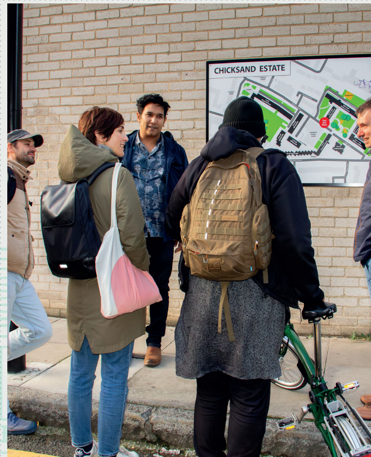
Figure 1: FVLab Londres : visites locales (Alessio Koliulis, août 2023)

Les partenaires clés du FVLab Londres sont tous membres du réseau Just Space, notamment : Clapton Commons , un centre communautaire à l'est de Londres ; Equal Care Co-operative , qui vise à créer un système de soins meilleur et plus juste. Plusieurs autres alliés participent à ce travail. Parmi eux : Spitalfields Housing Association , qui soutient à la fois le logement social et les marchés de rue et centres alimentaires communautaires ; Save Brick Lane campaign , qui s'oppose aux grands projets immobiliers d'entreprise et soutient les marchés de rue et les centres alimentaires communautaires ; Friends of Queens Market , militant pour la préservation de leur marché à Newham dans le cadre d'une réhabilitation urbaine ; Development Planning Unit (UCL) , qui fournit un appui académique ; Co Produce It CIC , une nouvelle coopérative défendant les intérêts des communautés locales fondée par les principaux activistes du projet FVLab Londres. Un autre partenaire est Future of London , dont les membres développent également des principes de co-production avec l'appui d'un doctorant.