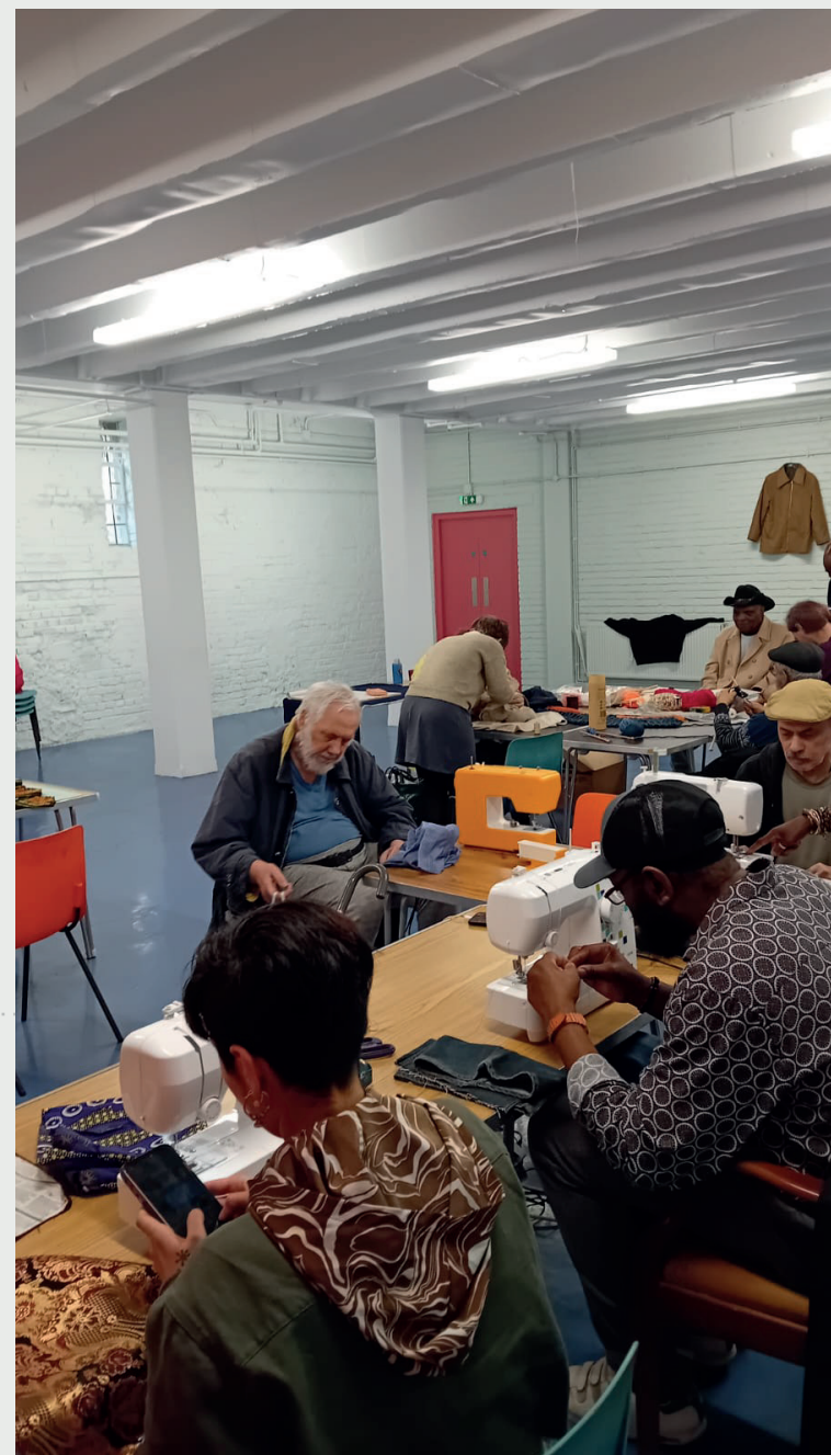
Figure 4: Craft gathering at Warm Welcome, offering skills exchange for all ages (Resident, 2024)

L'atelier d'évaluation a réuni les responsables d'équipe, les aidants, les membres de la famille, les bénévoles et les représentants de services de la communauté locale. Nous avons constaté qu'il existe des défis et des points d'attention pour mettre en œuvre la co-production de manière efficace :